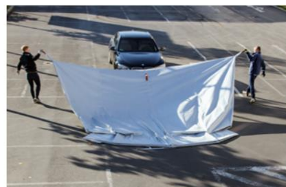
Gå fram i förskjutet riktning och dra filten över fordonet