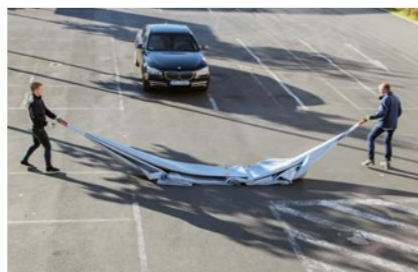
Gå utåt med de röda handtagen.