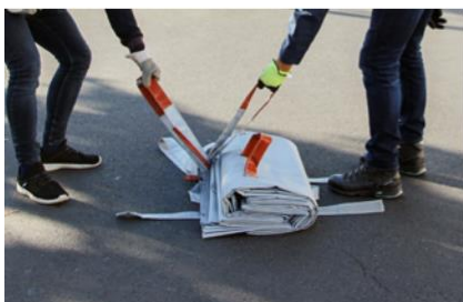
Öppna flikarna och håll i de röda handtagen.